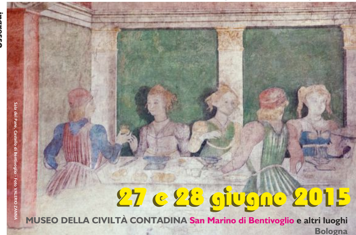
Sala del Pane, Castello di Bentivoglio

cibo, tradizioni, cultura legati all'oro della pianura